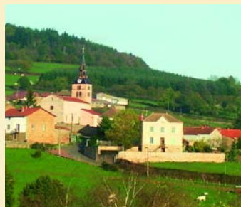
Accroché aux premières croupes charolaises

endre vers le bourg en laissant la route de « France » à droite. Après le carrefour suivant, emprunter un chemin de terre à droite ↙ sur l'église du XII e siècle). À son débouché, prendre à gauche pour contourner l'église, passer devant le monument aux morts et rejoindre la place.