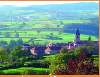
Le village surplombe la vallée de la Noue