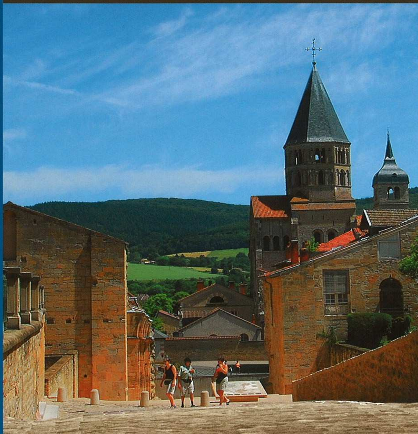
Abbaye de Cluny. - Michel Ferchaud-

19 circuits de petite randonnée, 1 circuit ville, 1 circuit week-end, 1 circuit routier de découverte